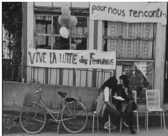
Genève, 1976, (Coll. Archives MLF Mouvement de libération des femmes).

L'association a été constituée à Genève en décembre 2007. Les membres du comité ont des parcours variés dans les domaines de l'histoire, de l'archive et au sein de différents mouvements sociaux et appartiennent à plusieurs générations.