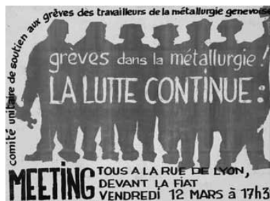
Anonyme, Genève, 1971 (Coll. Bibliothèque de Genève).

L'association assurera la conservation matérielle des documents et prendra toutes les mesures techniques permettant d'assurer leur préservation à long terme.