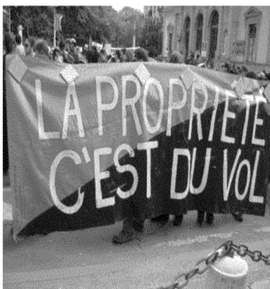
Genève, 2007 (Coll. privée).

mythiques. C'est pourquoi nous avons constitué l'association Archives contestataires pour identifier, conserver et valoriser les documents produits par les mouvements contestataires de la seconde moitié du XX e siècle.